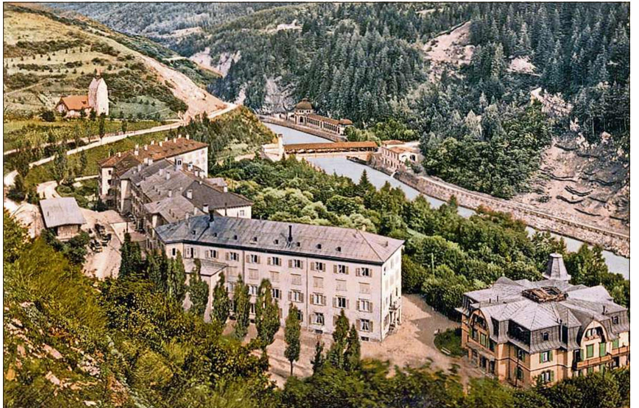
Ina part dals edifizis da cura da bogn a Tarasp-Vulpera. (1905).

D'implants per far bogn moderns e bain frequentads disponan Scuol, San