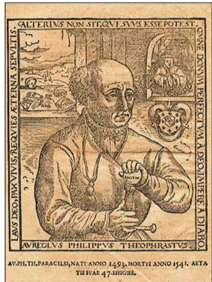
Paracelsus ha descrit il 1535 divers bogns en il territori retic.

manissem e la renaschientscha en il 16avel tschientaner, ed i circulavan las emprimas descripiuns da bogns. Il 1535 ha il scienzià universal da Nossadunnaun, Paracelsus, visità ils bogns da Buorm, San Murezzan e Faveras ch'el ha descrit en sia «De morbis tartareis». El è l'emprim ch'ha relaschà notizias medicinalas davart las funtaunas d'aua minerala curativas da la Rezia grischuna. Il 1545 ha alura descrit Peter Paulus Paravicini, in medi da Com, ils bogns da Masino e da Buorm («De Masinensium et Burmensium Thermarum [...]). Masino vegniva frequentà intensivamain da la noblezza grischuna durant il 17avel e 18avel tschientaner. Il 1553 è cumpari en la collecziun da texts «De balneis» da Tommaso Giunta il tractat «De thermis Rheticis» dal medi Gulielmus Gratarolus che tracta però pli detagliadamain mo ils bogns da San Murezzan e dad Alvagni; menziunads a l'ur èn Vulpera/Scuol, Le Prese/Poschiavo ed in bogn (Madesimo?) al Munt Spleia. Il bogn d'Alvagni era fer-